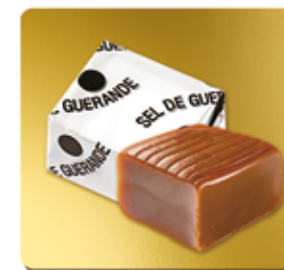
CAMEL SEL DE GUÉRENDE