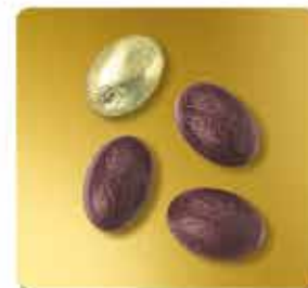
NOIR - FOURRÉ PRALINÉ