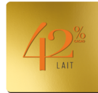
42% DE CACAO LAIT

Son goût intense en cacao, s'accorde particulièrement bien avec les fruits rouges tels que la groseille ou la framboise.