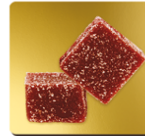
FRAISE MARA DES BOIS