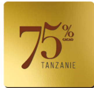
75% DE CACAO ORIGINE TANZANIE

Petit producteur de cacao, la Tanzanie produit des fèves rares mais recherchées pour leur belle puissance aromatique et leur palette d'arômes exceptionnelle.