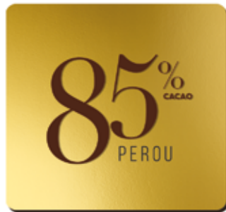
85% DE CACAO ORIGINE PEROU BIO*

Les fèves péruviennes se distinguent par une grande douceur et une acidité maîtrisée, qui permettent de produire un chocolat à très forte teneur en cacao.