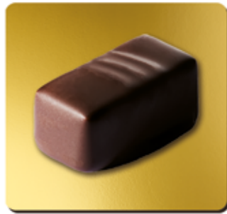
LINGOT DE CHOCOLAT NOIR FOURRÉ GIANDUJA 26% ET PRALINÉ AUX ÉCLATS DE CRÊPE DENTELLE