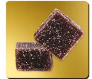
CASSIS DE BOURGOGNE