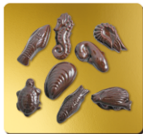
CHOCOLAT NOIR BIO* 56%