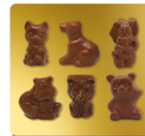
CHOCOLAT LAIT BIO* 41%