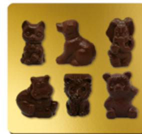
CHOCOLAT NOIR BIO* 70%

6 ANIMAUX : CHAT CHIEN ÉLÉPHANT HIPPO LION OURS