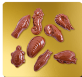
CHOCOLAT LAIT BIO* 41%