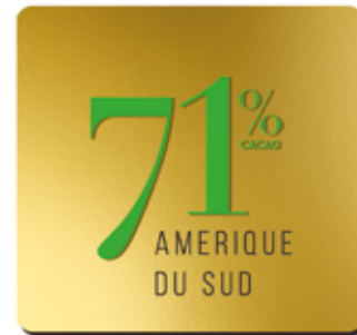
71% DE CACAO BIO*

Produit à partir de cacao du Pérou et de République Dominicaine, ce chocolat offre une belle fluidité et des notes de fruits rouges en fin de bouche.