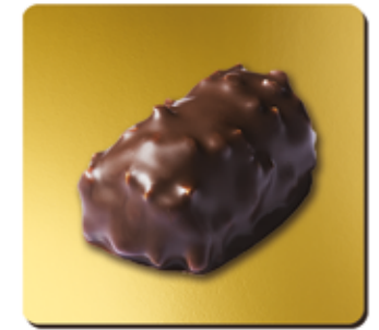
BUCHETTE DE CHOCOLAT NOIR FOURRÉE PRALINÉ, AUX ÉCLATS D'AMANDES VALENCIA