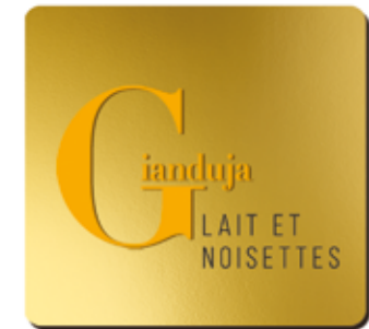
GIANDUJA BIO* LAIT ET NOISETTES

Ce chocolat au lait 42% de cacao aime les accords avec le caramel, le spéculos ou la noisette.