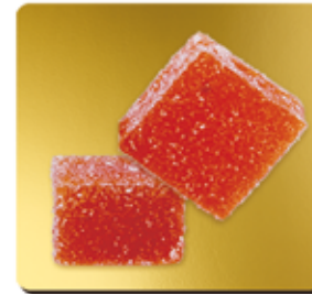
PÊCHE DE VIGNE DE LA DRÔME