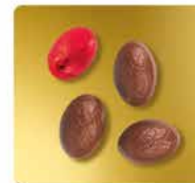
LAIT - FOURRÉ PRALINÉ