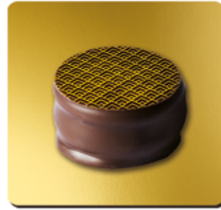
PALET DE CHOCOLAT NOIR INTÉRIEUR GANACHE AU CARAMEL ET À LA FLEUR DE SEL